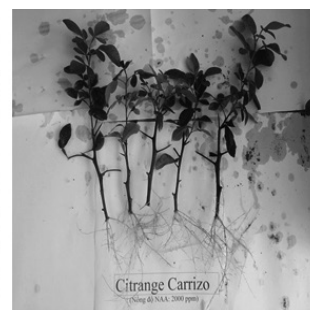
Hình 4. Citrange carrizo