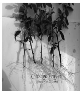
Hình 3. Citrange troyer